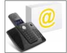
FR - Compatible boîtiers ADSL EN - Compatible with ADSL box