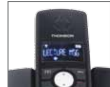
FR - Ecran 14 segments, rétro-éclairé EN - 14 segments, backlight display