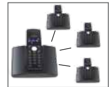
FR - Compatible GAP EN - GAP system