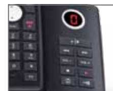
FR - Fonction répondeur (option) EN - Answering machine (option)