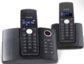
Existe en version duo Available in duo version